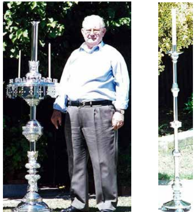
Мастер и его работы