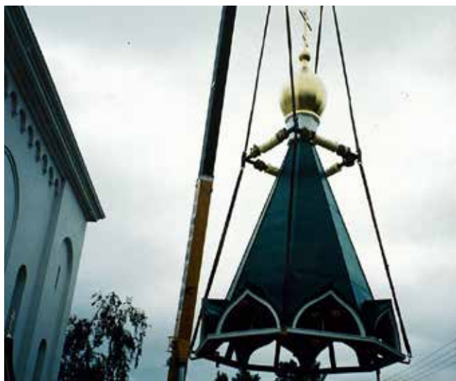
Подъёмный кран поднимает отреставрированный купол