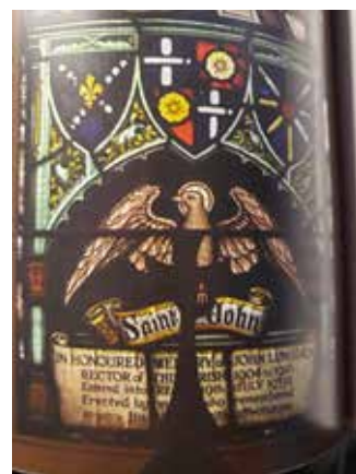
Витраж из Кентерберийского собора