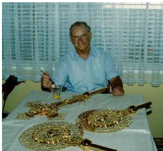
Процесс золочения рапид