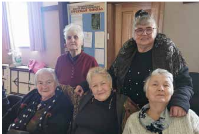
Наше старшее поколение – это наше сокровище опыта, наши искусницы в выпечке и кулинарии, наши многолетние молитвенницы

В воскресенье 18 июня в Свято-Николаевском храме отмечали праздник Всех Святых, в земле Русской просиявших. Все прихожане были приглашены после литургии на праздничный обед, организованный совместно