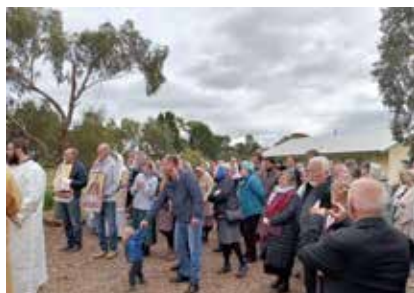
Крестный ход в монастыре