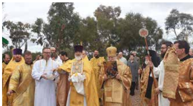
Крестный ход в монастыре