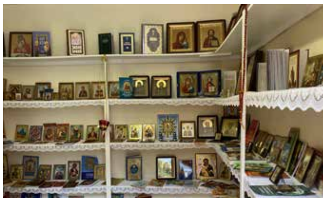
Силами сестричества был произведен ремонт Церковной лавки. Прихожане Храма могут найти в лавке иконы святых и православную литературу

необходимый ремонт, обновляется некоторое облачение, улучшается украшение храма на праздники. Он становится всё лучше и краше. Слава Богу за всё!