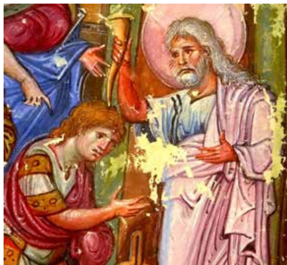
Святой Пророк Самуил помазывает Давида на царство. Миниатюра «Парижской Псалтири». Византия, X век. Фрагмент

– Сынок, сегодня второе, – поправил сына папа. – Причём, по светскому, григорианскому календарю. А Русская православная Церковь пользуется более древним календарём, юлианским, который ввёл Юлий Цезарь за 45 лет до рождения Иисуса Христа. Это более справедливо, сынок, ведь император Константин