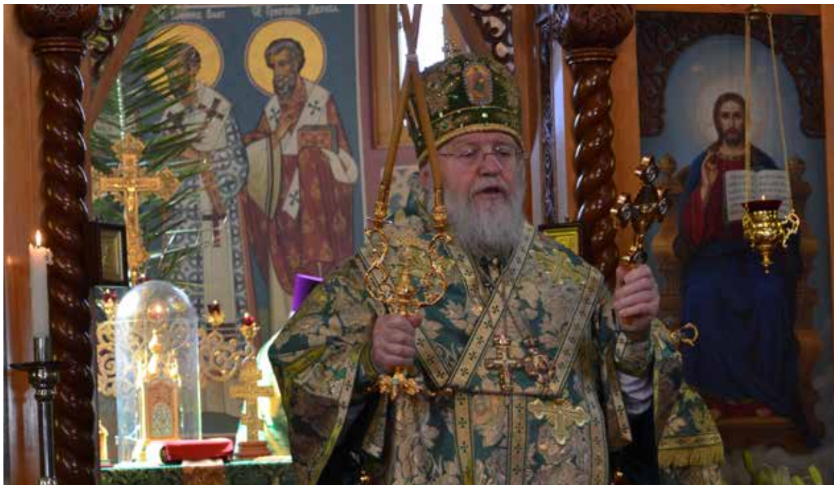
Вербное воскресенье 2014 года в Свято-Николаевском храме Аделаиды

И так судил Господь, что накануне этой памятной даты – 16 мая – к Нему отошёл один из наиболее значимых участников Воссоединения Русской Церкви – митрополит Восточно-Американский и Нью-Йоркский Иларион (Капрал), ставший Первоиерархом РПЦЗ после приснопамятного митрополита Лавра, но до конца своей жизни не оставивший и нашу Австралийско-Новозеландскую епархию, прослужив на ней более четверти века.