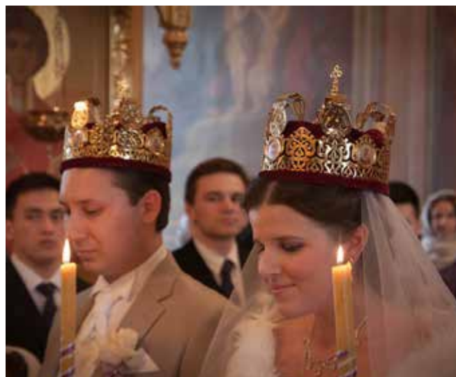
Венчание в храме Бориса и Глеба, 3 марта 2013г.

Через две недели созрело решение бросить всё и уехать обратно домой. Хотя уже из аэропорта сообщили, что вещи нашлись и доставлены в Москву. Но студенту семинарии было совершенно невозможно