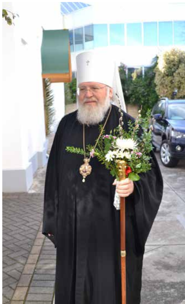
Вербное Воскресенье, 13 апреля 2014 года, Аделаида

Наверняка знаю: только вера позволяет человеку видеть реальность, очищенную от примесей лжи. Верующий человек просто чувствует подлог. Потому вера и объединяет: