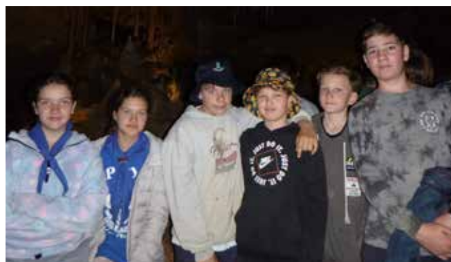
В одной из пещер Наракурты

«пещерную» одежду, одели шлемы, нацепили на шлемы специальные фонари – всё это было необходимо для того, чтобы иметь возможность пролезать в узкие проходы. Здесь были пещеры со сталактитами и сталагмитами, куда открыт доступ туристам, а также простые пещеры со множественными многокилометровыми проходами и узкими коридорами, которые могли неожиданно выйти на поверхность или наоборот закончиться тупиком. В одной из пещер мы видели на стенах пещеры живущих там сверчков (в полной темноте!). В другой пещере наряду со множественными сталактитами был оборудован целый музей, из скелетов падавших в подземелье через отверстия в земле животных, включая уже давно вымерших, таких как гигантские кенгуру и вомбаты. Это было очень интересное приключение! А вечером мы ходили к пещере, в которой живут летучие мыши – по вечерам они массово вылетают из пещеры на охоту. На следующий день мы