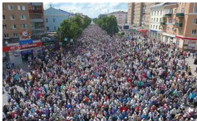
Крестный ход в Курске 25 сентября 2018 г.