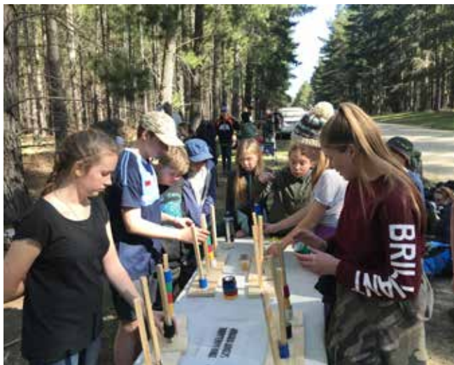
Наши ребята на контрольной точке

каждой точке. Это была хорошая практика для наших ребят. Они реально поняли, почему не надо вечером оставлять вещи под открытым небом (у того, кто оставил, утром все вещи – представьте обувь! – были покрыты инеем, ведь ночью было +1). Ребята получили реальную практику прохождения маршрута по карте и планирования самого маршрута. Опять же – всё делали сами: и установку палаток, и приготовление еды, и всё остальное. И хотя нашим ребятам не удалось пройти все точки (это удалось не многим), но польза от похода была.