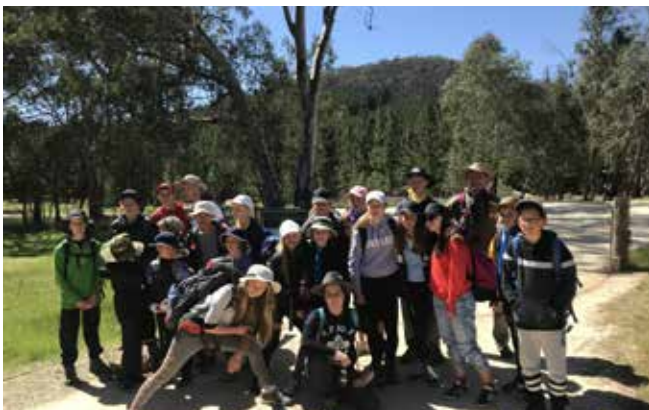
Походники на фоне горы Mt. Crawford

На весенних каникулах с 4 по 7 октября мы в том же самом месте провели наш дружинный бивуак. Наряду со скаутами участвовали и несколько ребят из стаи. Всего набралось 28 участников, из них ребят – 21. Мы провели поход на гору Mt. Crawford (во время предыдущего похода мы туда не ходили). Место оказалось очень красивым, при том, что со стороны создавалось впечатление, что всё будет очень