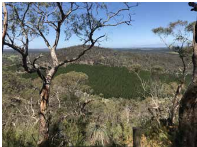
Вид с горы Mt. Crawford

а ребята показали австралийцам несколько наших точек. Поскольку на следующий день предстояла также большая программа, а затем обратная дорога, мы долго не засиживались и пошли спать пораньше.