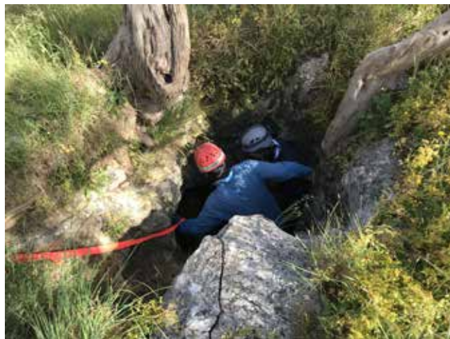
Спуск в дикую пещеру

18 ноября проводили австралийские скауты. Мы весь день катались на каяках, желающие прошлись под парусом. Был жаркий день, так что нам на воде было хорошо и многие с удовольствием отрабатывали переворачивание лодки и спасение «потерпевшего».