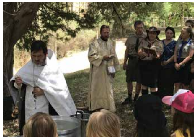
Летний лагерь. Водосвятие

В конце августа группа наших скаутов приняла участие в большом походе, District Nike, организованном австралийскими скаутами нашего района. Так совпало, что этот поход проходил в том самом месте, где у нас был намечен октябрьский бивуак – Mt. Crawford Forest. Так что мы смогли заранее присмотреться к местности. А ребята получили карту и координаты 22 контрольных точек, которые надо было самим нанести на карту, и через которые им надо было за два дня пройти (кто сколько сможет). Было два базовых лагеря и каждая группа, ночевавшая в первую ночь в одном лагере, к вечеру должна была прийти в другой, а на следующий день продолжить прохождение контрольных точек. Всего в походе приняло участие около 300 скаутов и достаточно большое количество руководителей, которые дежурили на контрольных точках, где также проводились какие-то виды активности для проходящих групп. Чтобы никто не потерялся, все точки поддерживали радиосвязь с базой, куда докладывали всю информацию о прохождении групп. Скауты получали баллы за прохождение точки и за выполнение задания в