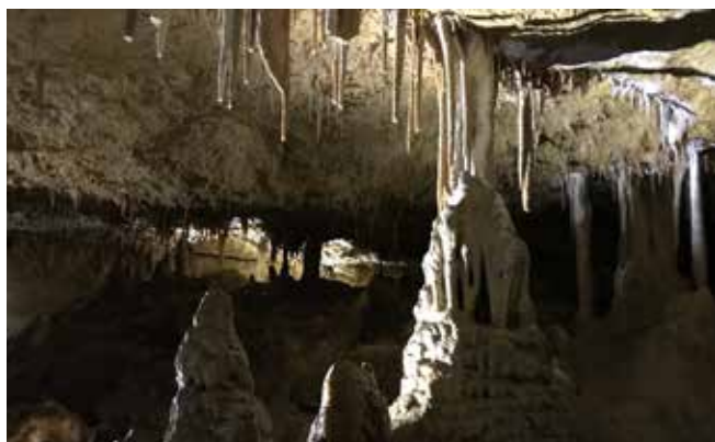
Сталактиты и сталагмиты

Едва прошёл лагерь, как надо было готовиться к Водному Дню (Water Activities Day), который