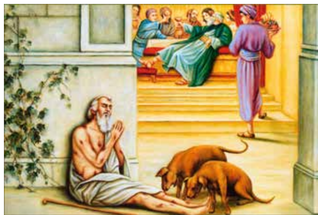
Лазарь и богач

И Бог ответит: «Живи восемьдесят лет здесь, на земле, так, как надо – и в вечной жизни тебя ждет непрестанное счастье, тепло, покой, умиротворение и радость». Разумное поведение. Потому и говорят про некоторых мучеников – надо же, несколько дней мучений, и всё, теперь они навсегда в раю, вкушают вечное блаженство! Видите? Христианин должен быть умным.