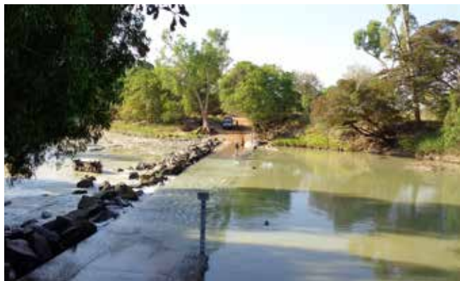
Малая вода на переправе обманчива. Слева видна перевёрнутая машина

Я подъехала к переправе и решила сначала оценить течение и уровень реки, а потом ехать. Я знала календарь прилива, поэтому рассчитывала, что подъехала вовремя. Понаблюдав за рекой, в предвкушении долгожданного момента встречи с Арнемлендом, я тронулась в путь. Реку переехала без проблем, хотя вода покрывала колёса наполовину. Асфальтированная дорога закончилась до переправы, начался путь по австралийской красной земле.