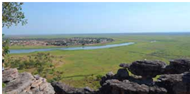
Вид с горы на Оенпелли

Второй дедушка – это не отец матери, а это дедушка дедушки (всегда по мужской линии),