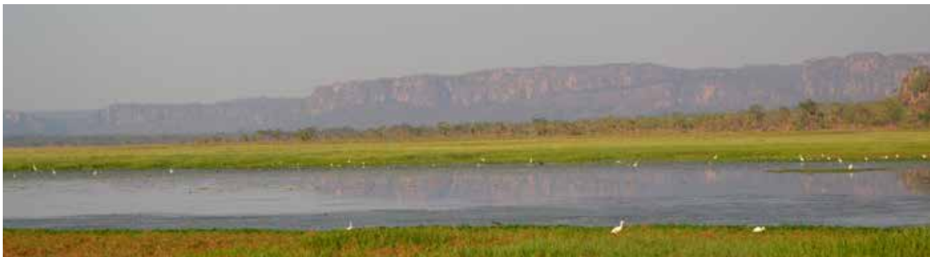
Биллабонг Оенпелли и его обитатели в вечерних лучах солнца