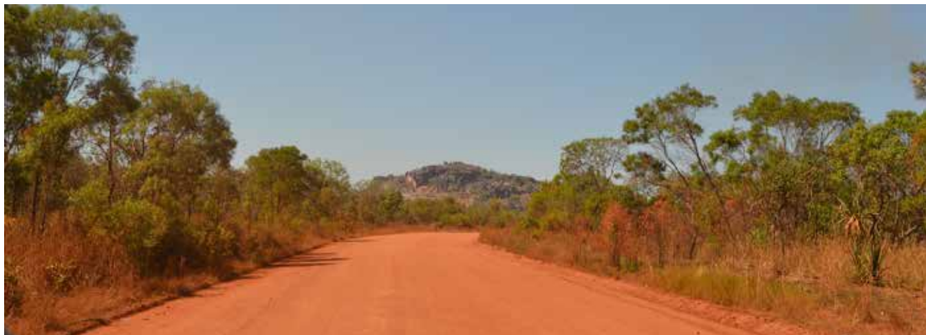
Дорога на Манингриду тянется через весь Арнемленд (около 500 км), и не на всём пути дорога такая ровная

Перелёт до Дарвина из Аделаиды немного утомительный, очень дорогой, но невероятно интересный путь, если лететь днём и в хорошую погоду. Мне повезло с погодой. Видимость была замечательная, и было интересно полюбоваться красотой нашего австралийского континента. В красивом ракурсе предстал горный хребет возле Алис Спрингс в самом центре Австралии. Но больше всего впечатлили следы паводковых вод – своеобразная паутина, охватившая гигантскую территорию. Сверху было хорошо видно, в каком направлении движется вода во время сезонных ливней. Может быть, не все знают, что в определённый сезон центральные пустынные районы Австралии оживают благодаря появляющейся паводковой и дождевой воде. Пересохшие ручьи оживают, выходят из своих берегов, и разливается вода на тысячи километров. Да, именно на тысячи! Например, реки Квинсленда доносят излишки своих вод до Южной Австралии.