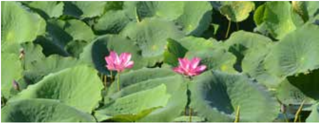
Лотосы на Жёлтой реке

было, на что посмотреть и чему удивиться. Впечатлили мутные быстрые воды Южной реки Аллигаторов (South Alligator River), а также количество и разнообразие ручьёв, луж, затонов и озёр, которые в мокрый сезон превращаются практически в один гигантский водоём на сотни квадратных километров. Нам в сухой Южной Австралии такое не ведомо. На этой дороге я впервые увидела знак ограничения скорости 130 км в час! Я буквально летела по дороге. То близко, то далеко от дороги был виден дым от лесных пожаров. Так как вокруг высохших прогалин много воды, то пожарные не спешат ничего тушить: всё само погаснет. Необычно.