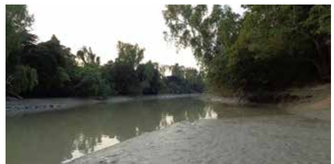
На вид – спокойная речушка с илистым берегом. Но она с крокодилами, и её уровень может быстро подняться на 2 метра!

Вот тут моя исследовательская натура почувствовала себя в своей тарелке. И наш с ним разговор затянулся до самого заката. Много лет назад я делала серию репортажей о людях редких профессий, и думала, что это были самые интересные интервью в моей жизни. Оказывается, нет предела совершенству.