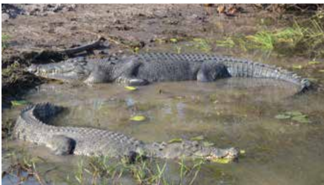
Гребнистые крокодилы загорают

В этих краях сейчас расплодилось огромное количество крокодилов. Например, я – простой гость этого края – за неделю видела их несколько десятков! Аборигенское сообщество бьёт тревогу, потому что стали получать сильные ранения или даже гибнуть люди. Раньше аборигены своей охотой держали под контролем увеличение поголовья крупных крокодилов. Местное население и раньше, и сейчас знает, в каком месте, где и сколько