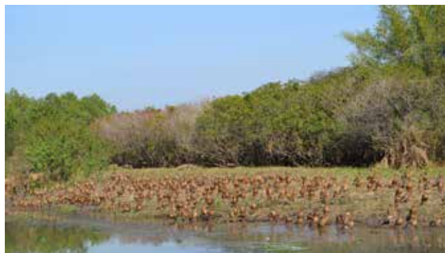
Сотни уток на берегу Жёлтой реки