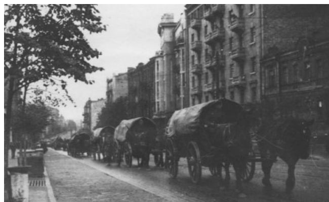
Немецкие обозы на улице Саксаганского