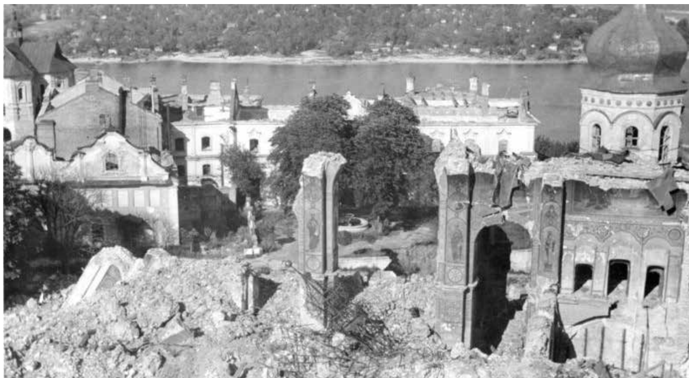
Взорванный Успенский собор Киево-Печерской Лавры

вниз и вбок. Он не вытирал свои слёзы, и они струились по небритым щекам, устремляясь прямо за шиворот. Его старая рубашка промокла на груди, а мои размышления о том, сколько у человека может вылиться слёз и где находятся мешочки со слезами, прервало неожиданное движение соседа: он бухнулся на колени и размашисто перекрестившись, стал молиться вместе с мамой. Он знал молитвы наизусть! Меня это поразило.