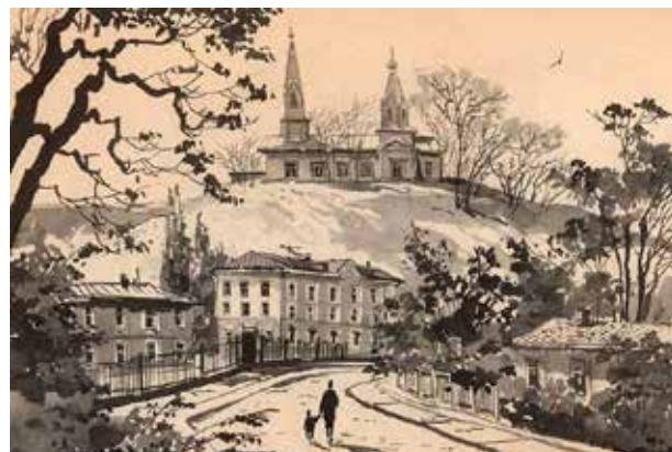
Храм Св. Макария на Татарке в Киеве

Как пример – писатель Евгений Шварц. Целым открытием для меня стало знакомство с творчеством этого автора довоенных и