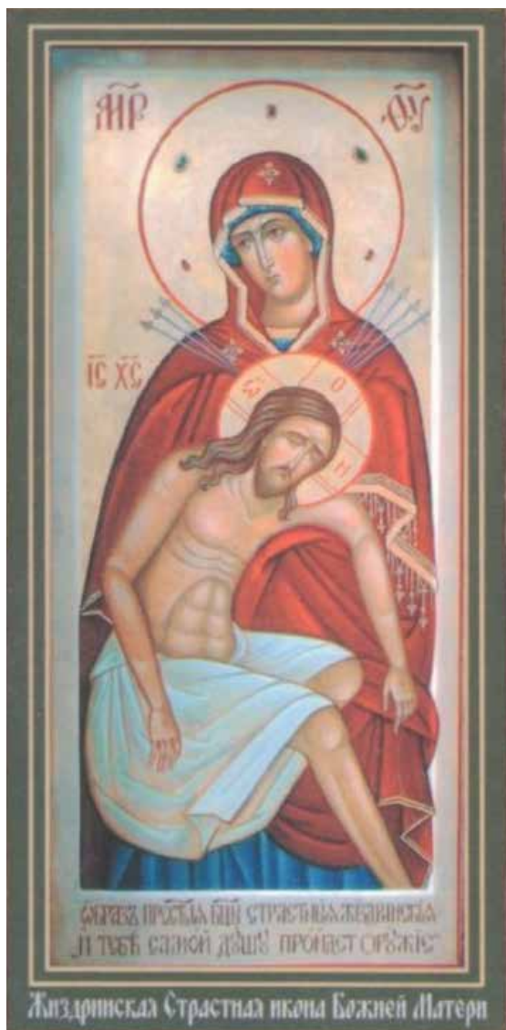
Икона Божией Матери «Жиздринская Страстная»

она написана на наклеенном на доску холсте, говорят о более позднем происхождении – видимо, этот список был сделан в XVIII столетии с не дошедшего до нас оригинала.