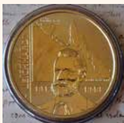
Австралийские монета и марки, посвящённые Людвигу Лейхгардту

Интересный факт: Людвиг (Фридрих Вильгельм Людвиг) Лейхгардт (1813-1848) – немецкий путешественник и геолог, известный исследователь Австралии – прапрапрадедушка нашего Дитера Хауптманна.