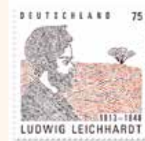
Немецкая почтовая марка