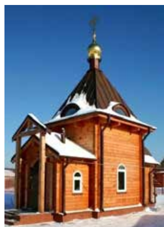
Храм-часовня в честь Иконы Божией Матери (Умягчения злых сердец), д. Бачурино