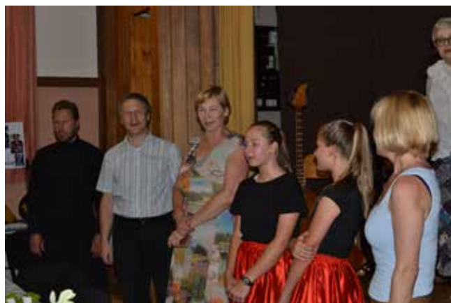
Хор исполняет «Многая лета»

Но надо сказать ещё пару слов о предстоящем событии в жизни нашей русской общины.