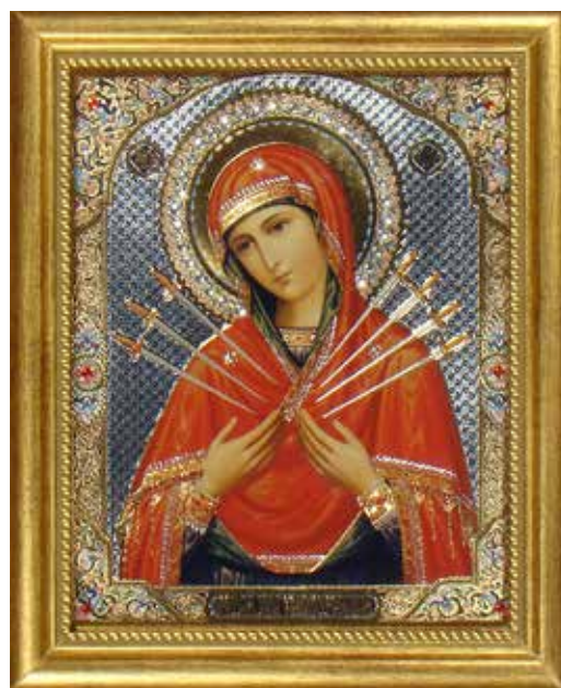
Икона Божией Матери «Семистрельная»

По преданию, «Семистрельной» более 500 лет, однако особенности живописи и то, что