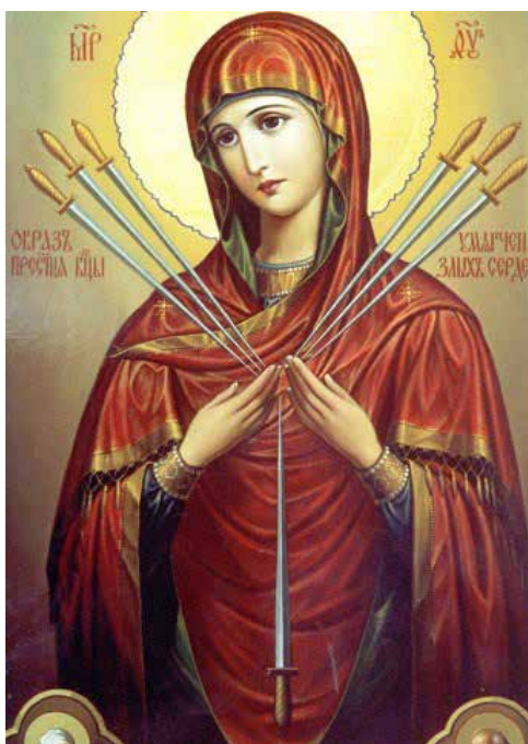
Икона Божией Матери «Умягчение злых сердец»

Икону Божией Матери «Умягчение злых сердец» называют еще «Симеоново проречение». На ней символически изображено пророчество святого Симеона Богоприимца, произнесённое им в Иерусалимском храме в день Сретения Господня: И благословил их Симеон и сказал Марии, Матери Его: се, лежит Сей на падение и на восстание многих в Израиле и в предмет пререканий, – и Тебе Самой оружие пройдет душу, – да откроются помышления многих сердец (Лк. 2:34-35).