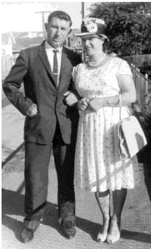
Первые дни в Австралии

женщины устроилась на работу в большую прачечную. Но основная жизнь крутилась, как и у многих из нас, вокруг Церкви, Русского Дома и русской школы.