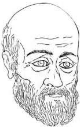
Реконструкция внеш- ности Свт. Николая

лая, исключённое из текста его жития в X веке, — деяние о подати. В IV веке несправедливой податью Ликия была доведена до разорения и голода. Присланный из столицы сборщик налогов, требуя всё новых и новых денег, постоянно унижал народ. Жители попросили своего архиепископа о заступничестве. Святитель Николай отправился в Константинополь, и после его разговора с императором подать была уменьшена в 100 раз. Это решение было записано в скрепленную золотой печатью грамоту. Но архиепископ знал, что под влиянием сановников Константин может отменить свой указ. Святитель обратился к Богу за помощью, и чудесным образом императорская грамота в тот же день оказалась в Мирах и была обнародована. На следующий день император, поддавшись уговорам, попытался изменить указ. Когда Святитель сказал, что документ уже зачитан в Мирах и, значит, вступил в силу, ему не поверили: до Ликии от Константинополя было шесть дней пути. Чтобы проверить слова Святителя, снарядили самый быстроходный корабль. Через две недели посланники вернулись и подтвердили, что ликийский сборщик налогов получил грамоту императора в тот день, когда она была подписана.