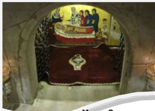
Мощи Святителя Николая в г. Бари

Во время Крестового похода святые мощи широко дарились. По миру до сих пор ходит довольно много частиц из этого венецианского ковчега, достоверность которых вызывает большие сомнения.