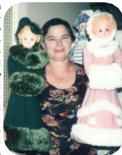
С куклами для лотереи

помогала таким организациям как Красный Крест, Ассоциация больных диабетом, Кардиологический Фонд и др. У неё есть награды не только от Российской стороны и русской общественности в Австралии, но и от различных австралийских организаций. Все медали и грамоты будет трудно перечислить: медаль от Австралийско-Новозеландской Епархии Русской Православной Церкви Заграницей (1998 г.), медаль «За усердие» от Совета Российских Соотечественников в Австралии (2011 г.), грамоту от Multicultural Community Council of SA и многие другие.