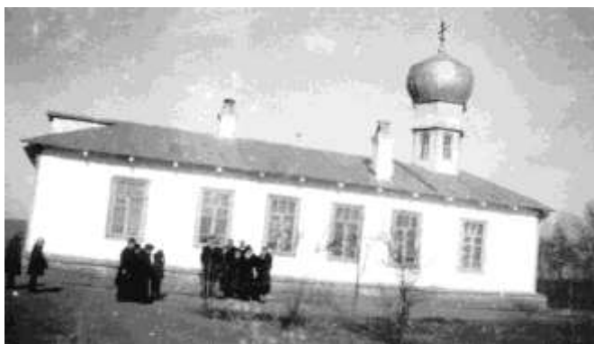
Церковь в Вейшахе, которая являлась также и школой. Когда не было церковной службы, помещение разгораживалось на две части: алтарь и большой зал, где и располагалась школа.